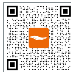
Enregistrement de réparation Maytronics