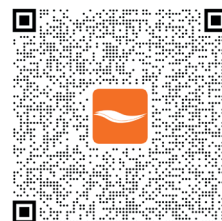
Enregistrement de réparation Maytronics