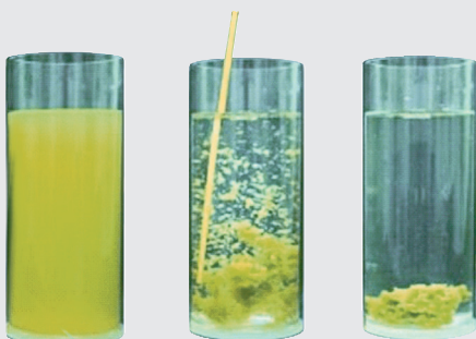
Flockung von gelösten Stoffen

Der Chlorverbrauch – und damit verbundene unerwünschte Chlornebenreaktionsprodukte – sinkt daher bei richtiger Flockungsfiltration mit APF um bis zu 80 %.