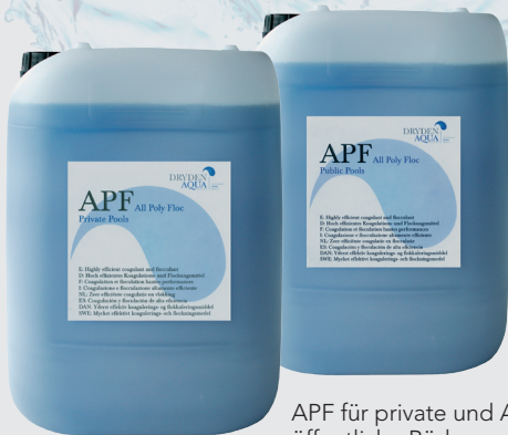
APF für private und APF für öffentliche Bäder