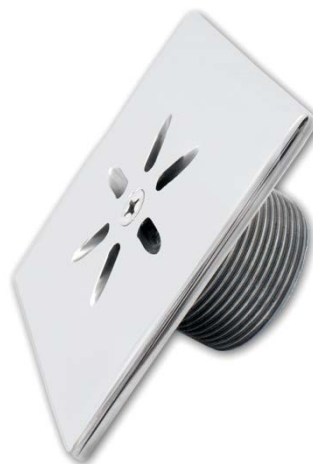
CUBE Line Bodeneinlaufdüse 100 mm