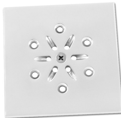
CUBE Line Bodeneinlaufdüse, 125 mm, flanschbar

CUBE Line Bodeneinlaufdüse, flanschbar, mengenregulierbar.