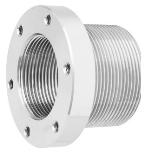
Grundelement für Bodeneinlaufdüse, mengenregulierbar

Gefertigt sind die beiden Bodeneinlaufdüsen aus hochwertigstem und äußerst widerstandsfähigem Edelstahl (AISI 316), die Sichtflächen werden bei BEHNCKE in einem aufwändigen Verfahren spiegelpoliert.